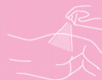
Skin protection oil spray 200 ml