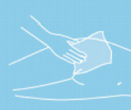
Moist skin care tissues