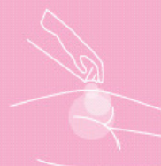
Skin protection foam 100 ml