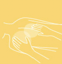
Massage gel 200 ml