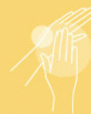
Hand creme 200 ml