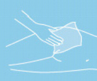
Moist skin care tissues