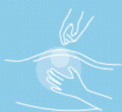
Skin cleansing foam 400 ml