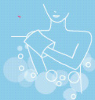
Skin care bath 500 ml