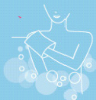
Skin care bath 500 ml