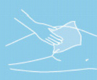
Moist skin care tissues