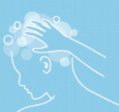
Shampooing 500 ml