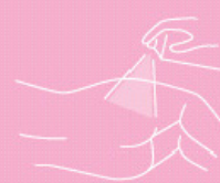
Skin protection oil spray 200 ml