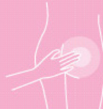
Skin protection creme 200 ml