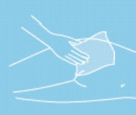
Moist skin care tissues