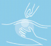
Skin cleansing foam 400 ml