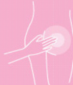
Skin protection creme 200 ml