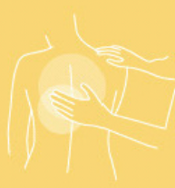
Skin care oil 500 ml