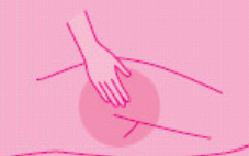
Transparent skin protection creme 200 ml