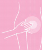
Skin protection creme 200 ml