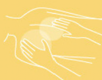
Massage gel 200 ml