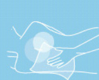
Body cleansing wipes