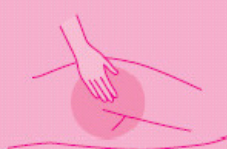
Transparent skin protection creme 200 ml