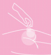
Skin protection foam 100 ml