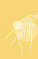
Hand creme 200 ml