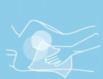
Body cleansing wipes