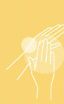
Hand creme 200 ml