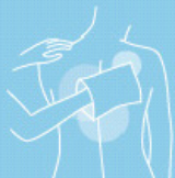
Wash lotion 500 ml