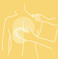
Skin care oil 500 ml