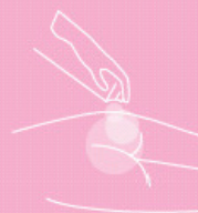
Skin protection foam 100 ml