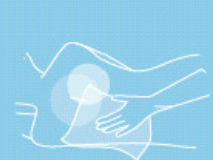
Body cleansing wipes