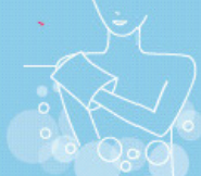
Skin care bath 500 ml