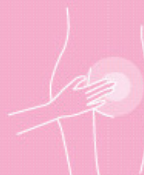
Skin protection creme 200 ml