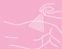
Skin protection oil spray 200 ml