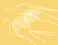
Massage gel 200 ml