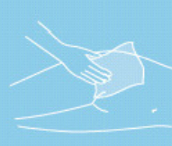
Moist skin care tissues